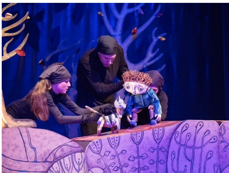
"Nije me strah" / Dječje kazalište Branka Mihaljevića u Osijeku

Izvor: kritikaz.com Autor: Igor Tretinjak